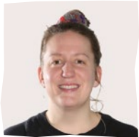
Auriane Auxiliaire 40%